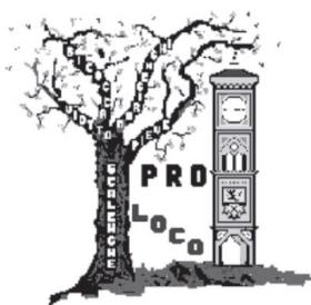
Pro Loco di Scalenghe