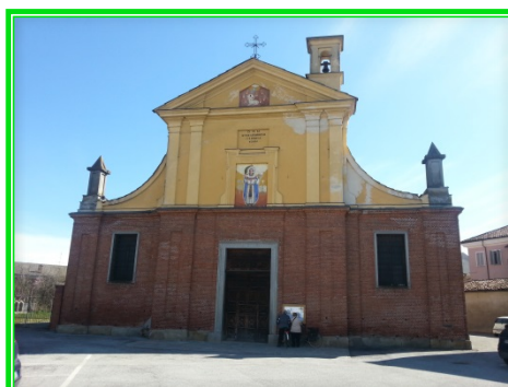
via S. Caterina