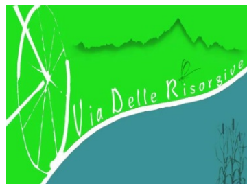
La via delle Risorgive