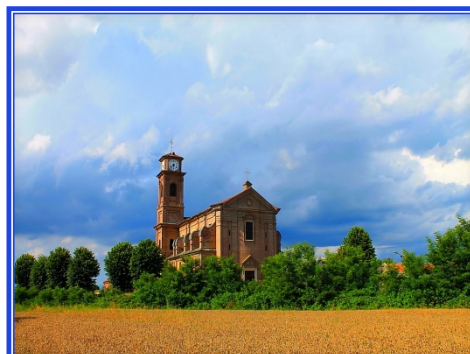
via Santa Maria