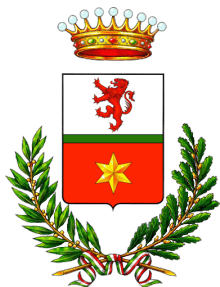
Comune di Scalenghe