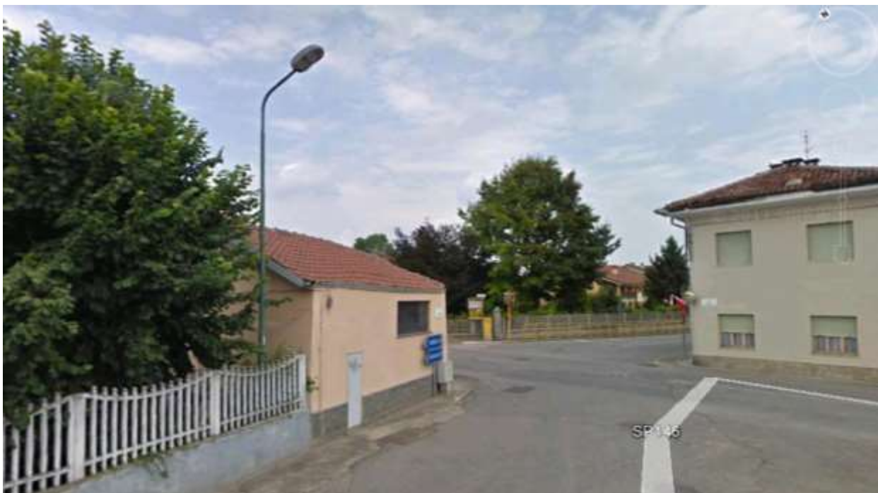
PUNTO ARRIVO COLLETTORE PRECEDENTE - SITUAZIONE ATTUALE