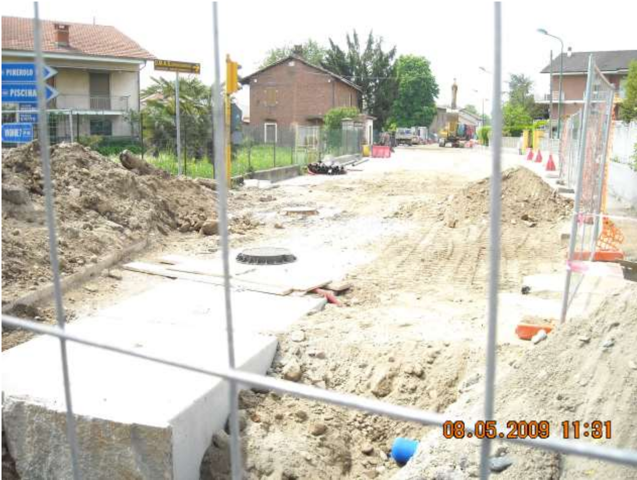
PUNTO ARRIVO COLLETTORE LOTTO PRECEDENTE