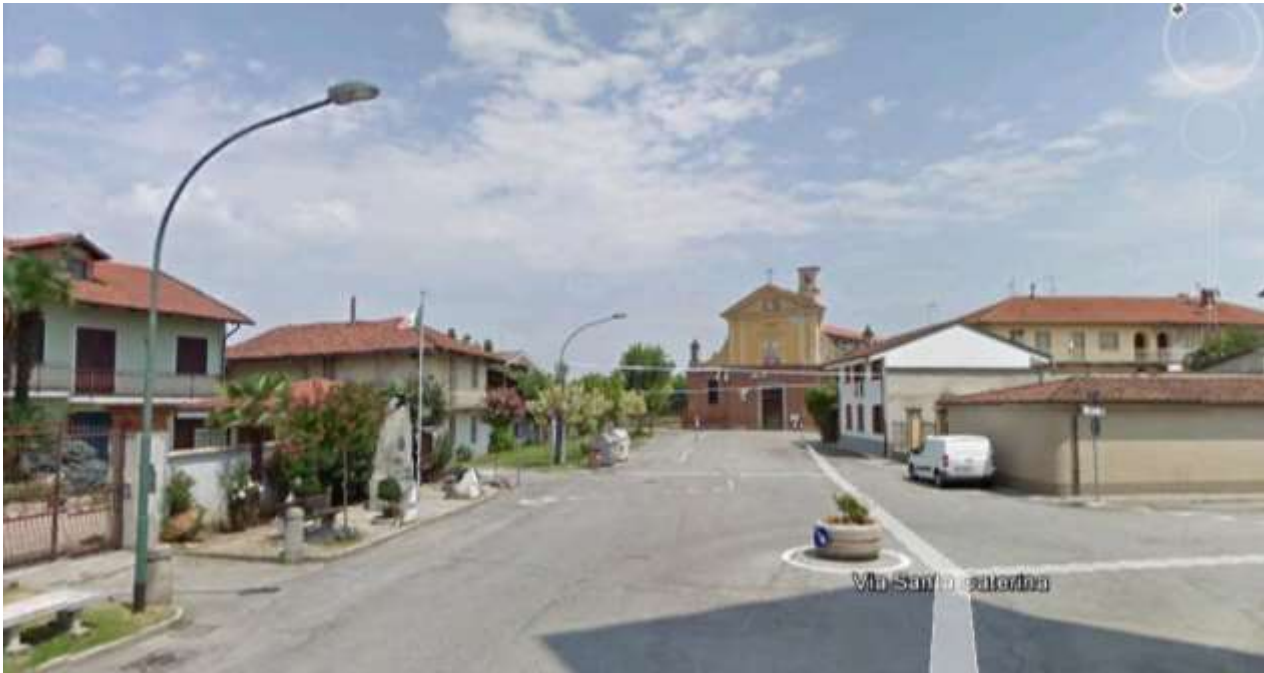
TRATTO VIA S. CATERINA