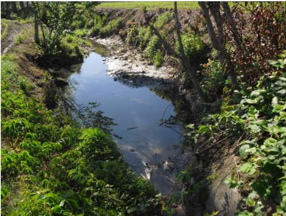
PUNTO DI SBOCCO NELLA GORA DEL MOLINO A CIELO APERTO