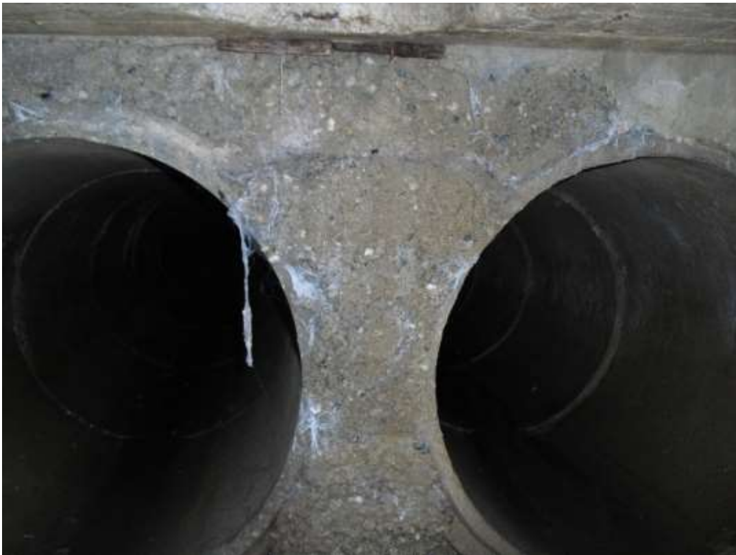
TUBAZIONI FI 800 SOTTO STRADA BARATTINA - UNO DA SOSTITUIRE CON FI 1200