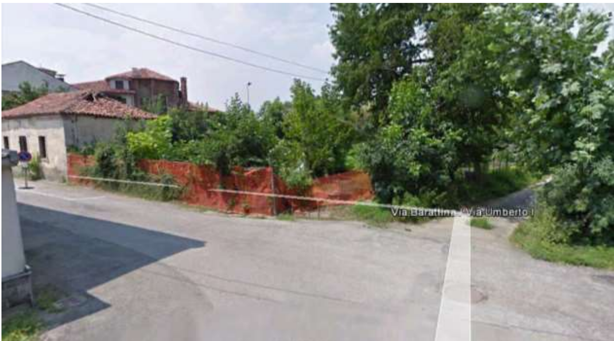
PUNTO DI INCROCIO TRA COLLETTORE IN PROGETTO E GORA DEL MOLINO