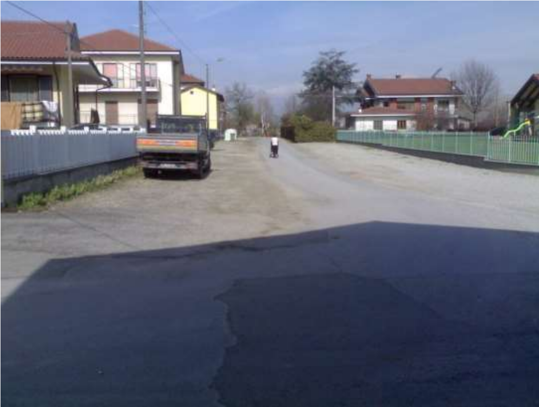
TRATTO STRADA BARATTINA