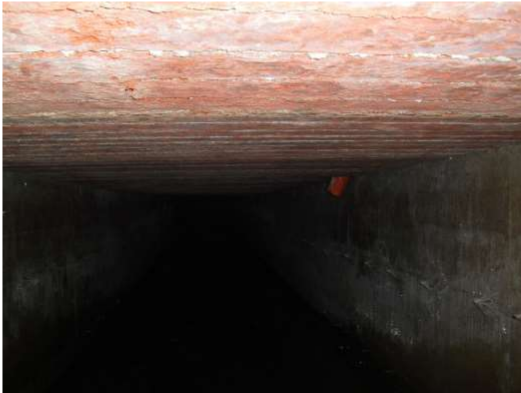
TRATTO ESISTENTE DA MANTENERE